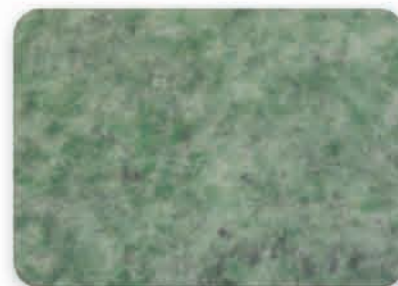
Gamrat ALTICA 9340 5102 7