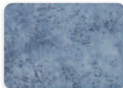
Gamrat ALTICA 9340 5102 8