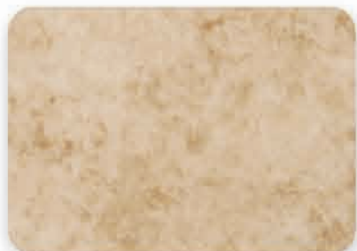
Gamrat ALTICA 9340 5102 1