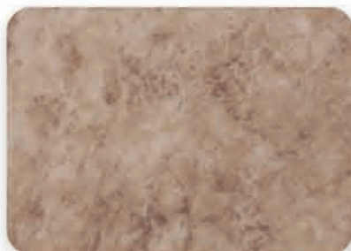
Gamrat ALTICA 9340 5102 2