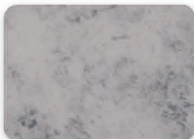
Gamrat ALTICA 9340 5102 5