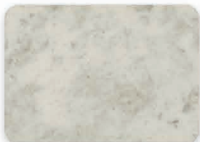
Gamrat ALTICA 9340 5102 4