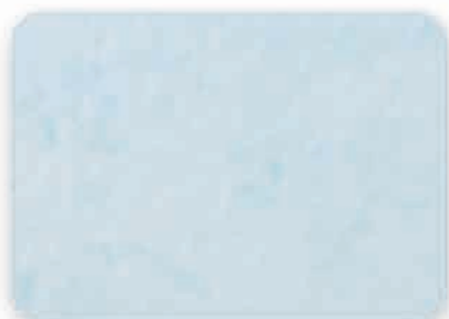
Gamrat FRESCO 9360 6002 6