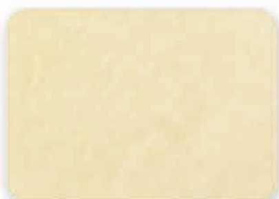
Gamrat FRESCO 9360 6002 1