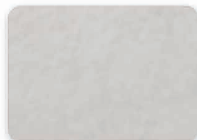
Gamrat FRESCO 9360 6002 4