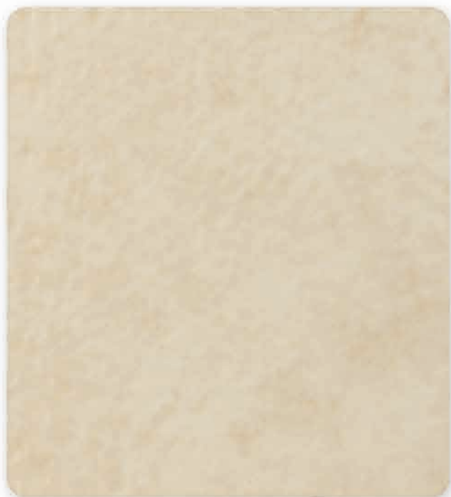
Gamrat FRESCO 9360 6002 3

GAMRAT Spółka Akcyjna ul. Mickiewicza 108, 38-200 Jasto gamrat@gamrat.com.pl www.gamrat.pl