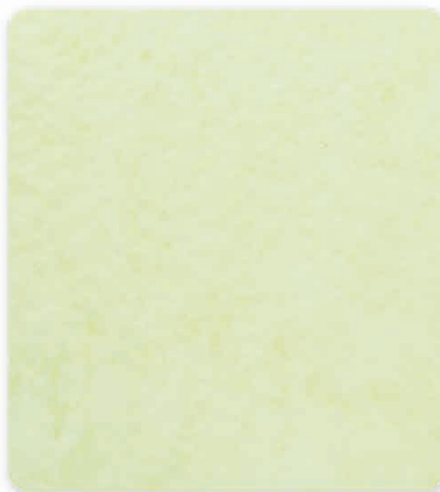
Gamrat FRESCO 9360 6002 5