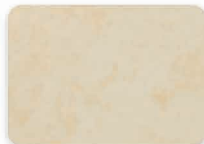
Gamrat FRESCO 9360 6002 2