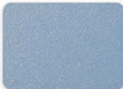
Gamrat SPORT 9370 0002 3