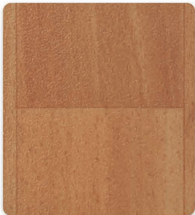
Gamrat SPORT 9370 0002 5

GAMRAT Spółka Akcyjna ul. Mickiewicza 108, 38-200 Jasto gamrat@gamrat.com.pl www.gamrat.pl