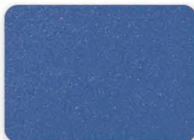
Gamrat SPORT 9370 0002 4